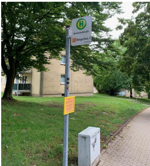
Abb. 39: Haltestellen des Bürgerbusses (links) und des Linienverkehrs (rechts)