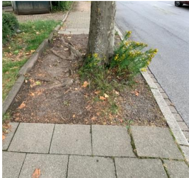
Abb. 40: Unterbrechung der Fußwegeverbindung durch Baumscheibe