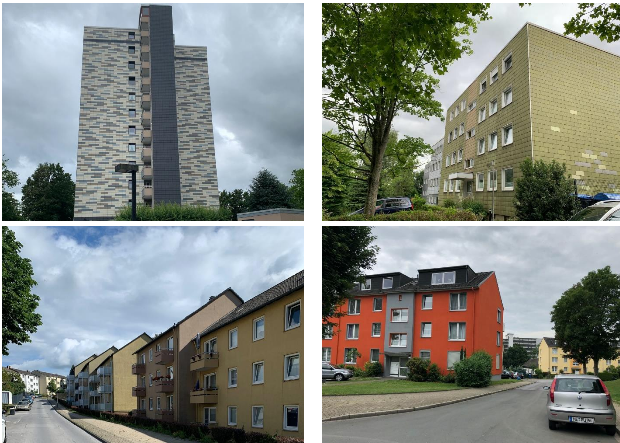
Abb. 27: Gebäudestruktur in den Siedlungsbereichen Oberilp und Nonnenbruch